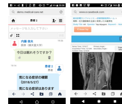
アプリによる服薬管理と医療相談

HIV感染者ではHIV非感染者に比べ、慢性合併症を有する患者の割合が高い(67.3% vs 34.9%)。このため、総合的な診療が大切である。(1,700万人のデータベース研究、JIC, 2019) 現在、ナショナルデータベースを用いてさらに大規模な慢性合併症管理と早期発見のための研究を実施中。