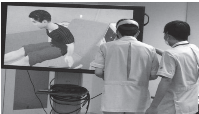
写真3 VR体験時の学生の様子

続いて2人目3人目と体験が終わる毎のデブリーフィングにおいて、ホワイトボードや事例からの情報を見直し、患者に何が起きているか、調べる必要のある情報について考える機会を持った。その間に、「根拠や順番を考えていなかった」という気づきを、次の実施者に伝える学生の姿がみられた。すると、「さっきは右側しか見てなかったの、逆の左側もみてみます」等と、実施者は自分の考えを声に出しながら観察する際の思考を周囲の学生と共有していた。そして進めていく内に肺音の雑音や血圧低下、両下肢浮腫等と情報が揃うにつれ、一人の学生から「心臓がうっ血しているのでは」という言葉が発せられた。そしてそこ