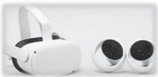
写真1 使用機器

フトの内容は、呼吸器系、循環器系症状のある外来患者のフィジカルアセスメントを実施するものである（詳細は表1、写真2参照）。